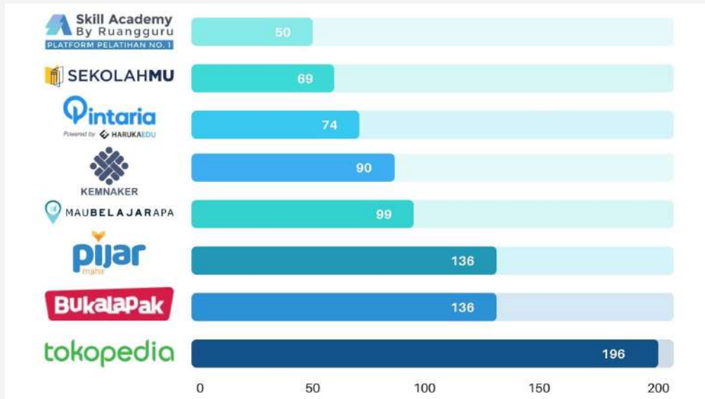
Grafik 1 Sebaran Pelatihan Berdasarkan Platform Digital

Dari 850 jenis pelatihan, platform digital Tokopedia yang paling banyak menawarkan pelatihan, yaitu 196 pelatihan. Untuk Pijar Mahir dan Bukalapak, masing – masing menawarkan 136 pelatihan, MauBelajarApa sebanyak 99 pelatihan, Kemnaker sebanyak 90 pelatihan, Pintaria sebanyak 74 pelatihan, Sekolah.mu sebanyak 69 pelatihan dan paling sedikit Skill Academy sebanyak 50 pelatihan